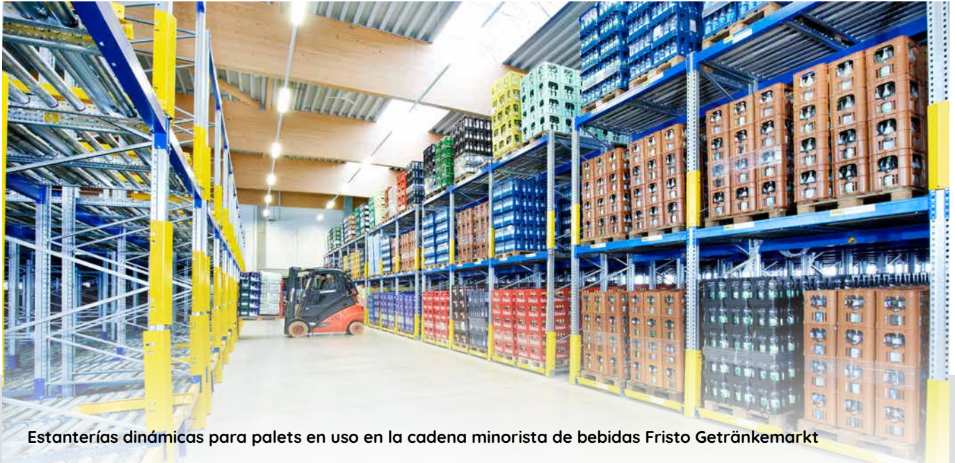
Estanterías dinámicas para palets en uso en la cadena minorista de bebidas Friso Getränkemarkt

Las estanterías dinámicas para palets sólo necesitan dos pasillos de servicio situados en extremos opuestos: un pasillo se utiliza para la carga de mercancías y el otro para la preparación de pedidos, ahorrando hasta un 60% del espacio de almacenamiento necesario en las estanterías estáticas.