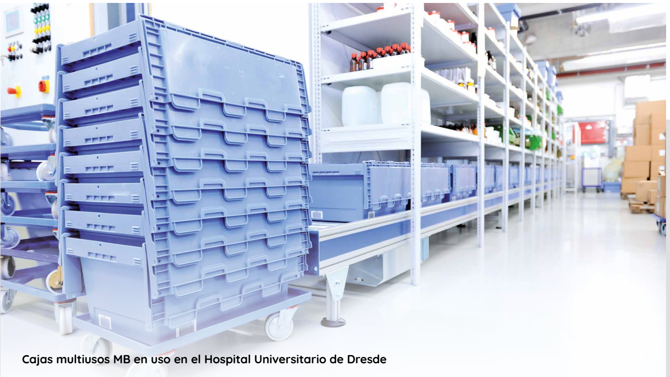
Cajas multiusos MB en uso en el Hospital Universitario de Dresde

Las cajas MB son verdaderas todoterreno: