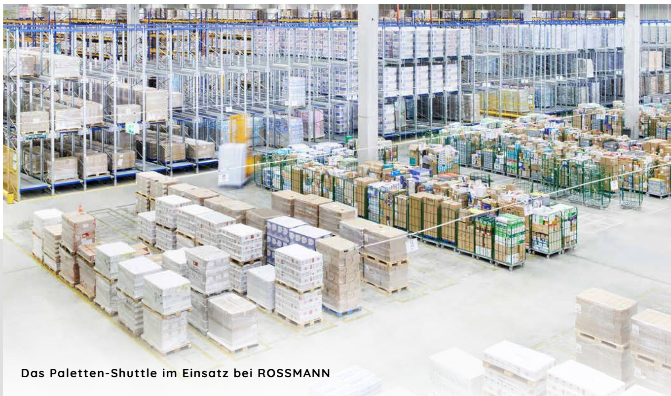
Das Paletten-Shuttle im Einsatz bei ROSSMANN

In dem Lagergang transportiert das Shuttle die Paletten selbstständig. Ein Gabelstapler wird verwendet, um das Shuttle zwischen den Gängen zu bewegen. Das System kann sowohl in FIFO- als auch in LIFO-Anwendungen eingesetzt werden. In einer Tiefkühlumgebung bis zu -30 °C kann das Shuttle eingesetzt werden.